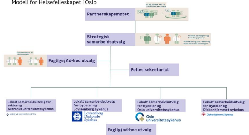
Modell for Helsefelleskapet i Oslo