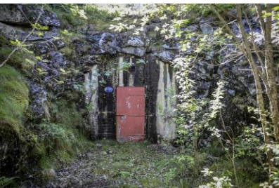
FAST BIVTENE SVICERNE DØREN: Bildet viser det lokale vannverket, som rådføres i vanskelige situasjoner.